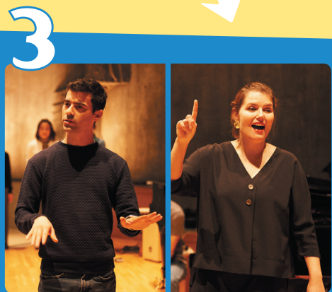
講師によりワークショップ・リーダーの選出やグループ分けが行われます。

東京文化会館では、最先端の教育普及活動を行っているポルトガルの音楽施設「カーザ・ダ・ムジカ」と連携し、音楽の喜びや楽しさを、新たな切り口で幅広い層に伝えるための人材を育成しています。