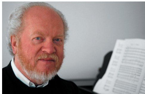
ゲルハルト・オピッツ