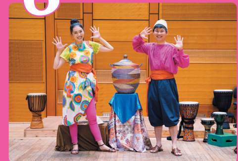
こうして選ばれたワークショップ・リーダーたちが、子供から大人まで様々な方を対象にしたワークショップを盛り上げてくれます。