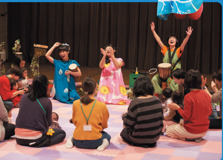
皆でワークショップを創作！手直しなどを経て皆さんへお披露目します。

東京文化会館では、最先端の教育普及活動を行っているポルトガルの音楽施設「カーザ・ダ・ムジカ」と連携し、音楽の喜びや楽しさを、新たな切り口で幅広い層に伝えるための人材を育成しています。